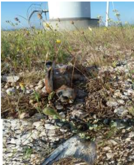
Cadavre de faucon crécerellette au pied d'une éolienne

Euh... ben non, puisqu'il s'agit d'éoliennes, il suffit de demander des dérogations.