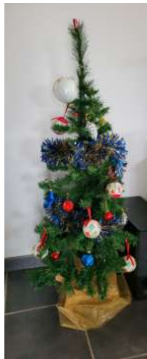
A notre droite le roi du plastoc