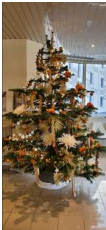
A notre gauche le roi des plantations

Il n'empêche, à part les écologistes les plus radicaux qui ont renoncé depuis longtemps à décorer leur maison à l'approche de Noël -on le savait déjà, ils aiment les animaux- pas les enfants- vous êtes nombreux en ce début de mois de décembre à vous poser une question existentielle : faut-il opter pour un sapin en plastique, ou pour un arbre en bois, quitte à tuer ce dernier de nos propres mains ? Le match est incertain :